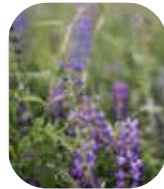
Lupin à folioles nombreuses