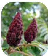
Synac de Virginie